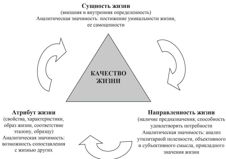
Рис. 2. Проекция трехэлементной модели категории «Качество» на расширенную категорию «Качество жизни»

В целях исследования нас будут интересовать концепции качества жизни, наиболее полно раскрывающие его сущность и имеющие прикладное значение в современной управленческой практике для масштабных объектов исследования. Возвращаясь к интерпретации понятий и акцентируя внимание на экономико-управленческом аспекте, следует особо отметить определение качества Международной организацией по стан-